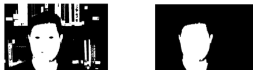
图2 数学形态学处理结果

然后,通过连通区域标记法对图像中的连通区域进行标记,根据连通区域内的像素数量,分析并去除连通区域中明显不是人脸的区域。再将计算出的连通区域像素数量从大到小进行排列,取最大值进行保留,其余部分变为与背景同色。经过连通区域标记筛选后的人脸区域如图3所示。从图3可以看出,图像中人脸区域杂点及背景中的误检测全部被成功去除,只剩下面部及颈部区域。