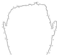
图5 颈部轮廓去除效果

构造人脸下巴轮廓的方法很多,本文所使用的是基于轮廓位置信息的数据拟合方法。由于人脸轮廓近似于一个椭圆形,因此可以将图5中断开两点用平滑曲线连接起来。首先由人脸轮廓区域得到与该区域近似的椭圆长短轴以及中心点等参数,然后由这些参数拟合椭圆,进而构建出人脸下巴轮廓。由于提取出的人脸轮廓是单像素线条,不易观察,故需要对轮廓加粗处理。最简单的加粗方法就是通过膨胀算法。图6中白色曲线即为经过加粗的人脸轮廓曲线。从图6可以看出,人脸下巴轮廓可以较好地拟合出来。