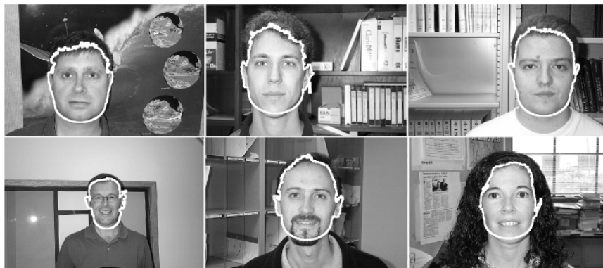
图7 部分正确的人脸轮廓实验结果

特征.但是由于存在肤色误检以及系统误差等因素,通过椭圆拟合得到的数据可能并不十分符合真实情况,故会对下巴轮廓拟合构建产生一定的影响.