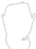
图4 初步人脸轮廓提取结果

本文仅对存在颈部区域的情况进行颈部去除算法介绍。首先,通过区域宽度计算出人脸宽度 W ,则人脸长度 H = R \times W ,由于所得到的人脸的长度 H 值是从下巴到额头之间的距离,那么如果从下巴最低点开始去除轮廓,则必然还会留有一部分颈部轮廓。通过分析,我们将 H 的值适当缩小到原有长度的80%,即保留初始人脸轮廓长度的80% H 。颈部轮廓去除效果如图5所示。