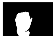
图3 连通区域标记结果